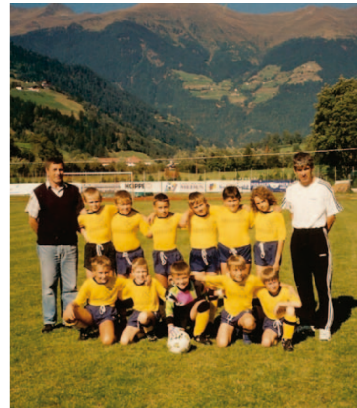
Im Bild: Unsere D-Jugend aus dem Jahre 1997/1998